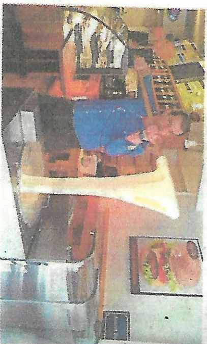
L'allgot aveyronnais, très apprécié par les Toulousains l'hiver.

➤ Allgot Bar, 35 rue du Taur. Horaires : du lundi au jeudi (9h-17h), vendredi (9h-16h), samedi (9h-22h) et dimanche (9h-17h).